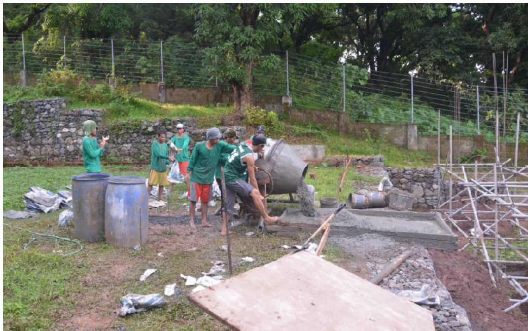
Första lasset cement formar den viktiga grunden - en förutsättning för att huset skall bli stabilt.