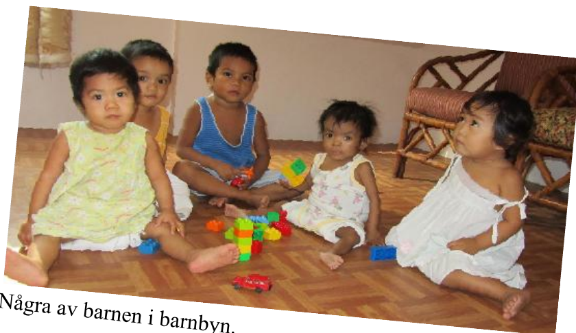
Några av barnen i barnbyn.